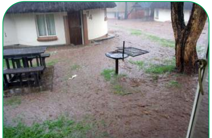
Stormwaterprobleme soos hierdie is binnekort iets van die verlede.