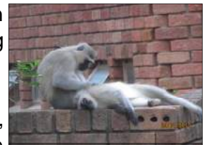
Gaste Tjoppie en Wors

die “man, weet jy wat?”... “wens jy kon dit sien ...” en “was dit nou lekker gewees...” en ja, glo dit, 'n paar van die manskoorlede het kele skoongemaak en is nou reg vir die jaar se uitdagings.