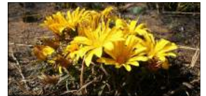
Botterblom— Gazania krebsiana

En dan kom die invul van die ruimtes tussenin met allerhande interessantheide, insluitende talle kleurryke vygies, grondvlak aalwyne soos die Blouaalwyn ( Aloe striata ), Varkoorplakkie ( Cotyledon orbiculata ), Sekel-crassula ( Crassula perfiolata ), Skoonma-se-tong, Katstert ( Bulbine frutescens ), die verskillende rosetvormige Echeveria's, 'n wye keuse. Vir grondbedekkers is daar Suurvy ( Carpobrotus deliciosus ), Aptenia, Botterblom ( Gazania krebsiana ), die verskillende spesies gousblomme en nog meer.