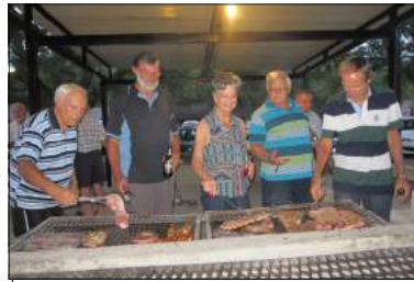
Wie braai wie se vleisie, die dame die mans s'n?

Die Vlytige Voete het hul 2014 aksies afgeskop deur die inwoners in drie groepe te verdeel en daar is toe heerlik gebraai en gekuier by die Oog se drie braai areas. 'n Rekord getal van 165 inwoners het die stilte van hul huise verlaat en die aandlug het behoorlik gegons van