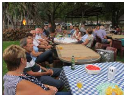
Gesellig in die tentkamp