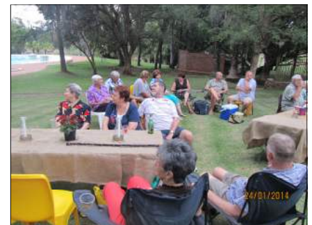
Koue swembad kuier-kaskenades