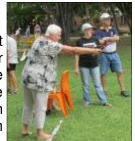
So moet 'n kettierek getrek word manne!

Die laaste item het vir groot pret gesorg toe daar "musical chairs" gespeel is en 'n paar deelnemers probeer kroek het en amper gediskwalifiseer moes word! Daarna het elke span hulle kreet geskree waarvoor hulle ook punte gekry het en ek glo vas ons kreet wat die klein 9 jarige vir ons geleer het, was hier die wenner: